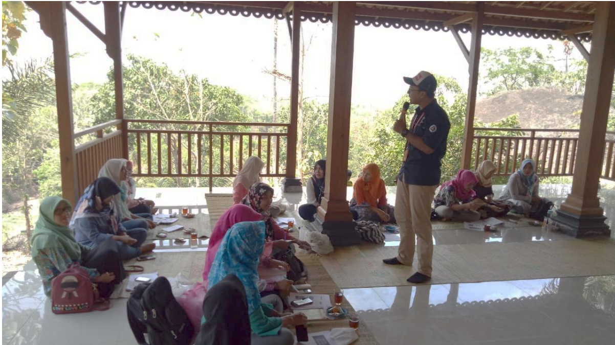
Gambar 2. Pelatihan Go Online hari kedua.

Para pelaku atau pengelola UMKM yang hadir adalah UMKM yang diundang ataupun mendaftar untuk mengikuti kegiatan ini. Hanya belasan UMKM yang hadir dari puluhan UMKM yang ada di Kecamatan Patuk. Salah satu penyebabnya adalah para pelaku UMKM yang sebagian besar masyarakat pedesaan merasa tidak percaya diri untuk belajar hal baru. Beberapa ketakutan yang muncul yaitu berkaitan dengan umur, tidak percaya diri dengan produknya dan yang paling penting adalah kesadaran untuk dapat terus berkembang.