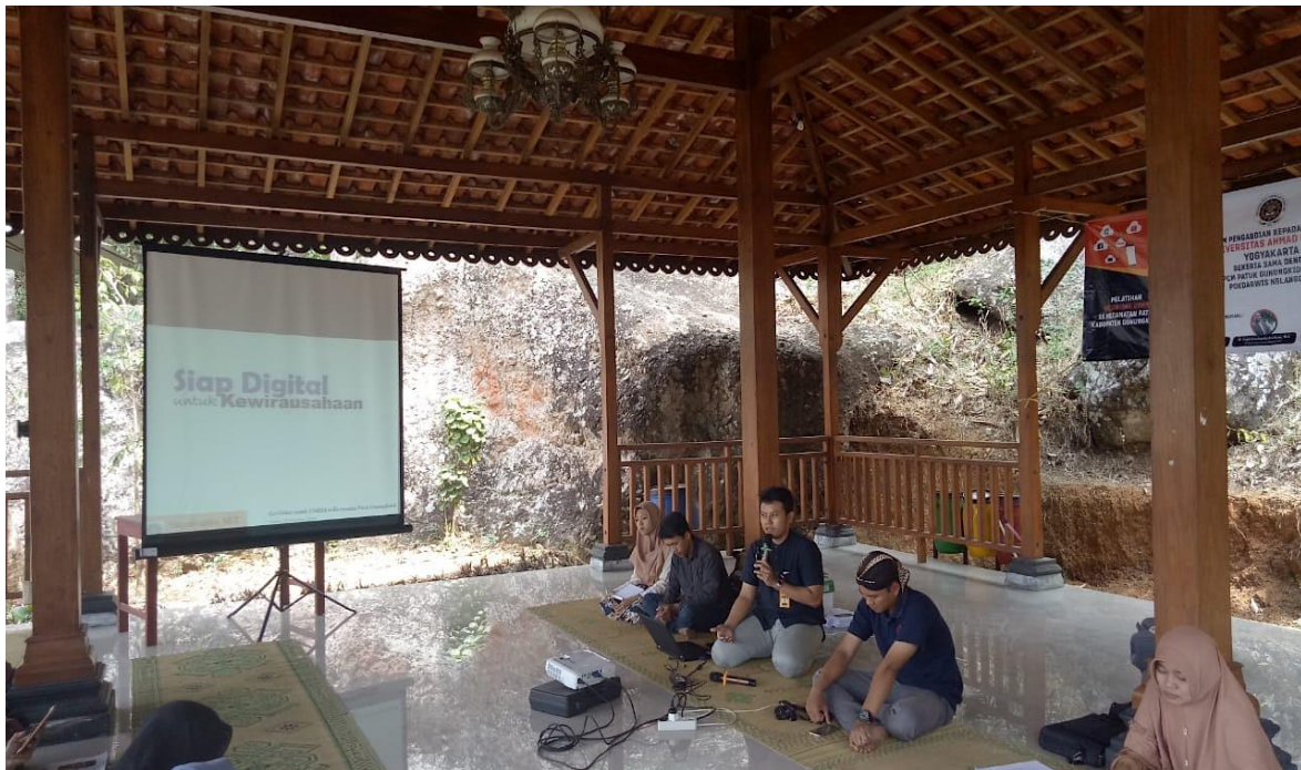
Gambar 1. Pelatihan Go Online hari pertama

Pelaksanaan Go Online dibagi ke dalam 2 hari yaitu hari sabtu dan ahad. Hari pertama ditunjukkan oleh Gambar 1, diisi dengan kegiatan seminar, penyuluhan dan pelatihan dengan mengusung tema Siap Digital. Para pelaku UMKM diharapkan dapat benar-benar siap untuk tahap selanjutnya yaitu terjun ke dalam dunia digital dan daring. Materi hari pertama disampaikan oleh narasumber yang memiliki latar belakang teknologi informasi dari Teknik Informatika Universitas Ahmad Dahlan.