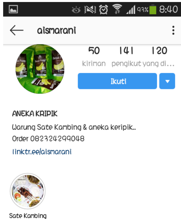
Gambar 3. Kutipan akun Instagram UMKM Aneka Keripik

Contoh berikutnya dari UMKM yang sebelumnya sudah memiliki akun media sosial juga memiliki peningkatan pengikut dan jumlah unggahan seperti terlihat pada Gambar 4. Akun UMKM kampung emas misalnya dengan produk ayam ingkung telah memiliki lebih dari seribu lima ratus pengikut dan tiga ratus unggahan.