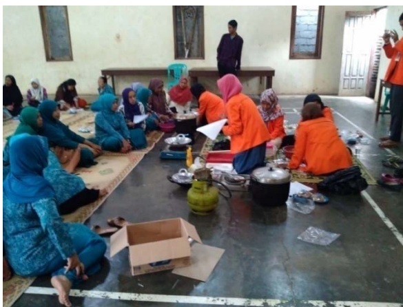
Gambar 3. Pelatihan membuat nugget tempe

Dari gambar 2 dan 3 menunjukkan penerapan program KKN dalam bidang pemberdayaan untuk kaum wanita di Desa Karanggondang dapat terlaksana dengan baik dan didukung partisipasi masyarakat yang tinggi. Dampak dari kegiatan KKN di lokasi ini adalah : 1) terwujudnya kesadaran akan pentingnya berwirausaha untuk meningkatkan perekonomian keluarga pada khususnya dan masyarakat pada umumnya 2) memberikan pengetahuan mengenai pemanfaatan salah satu potensi yang ada di Desa Karanggondang yaitu jahe 3) kaum wanita di Desa Karanggondang paham dan terampil dalam merintis usaha pembuatan serbuk jahe instan dan nugget tempe.