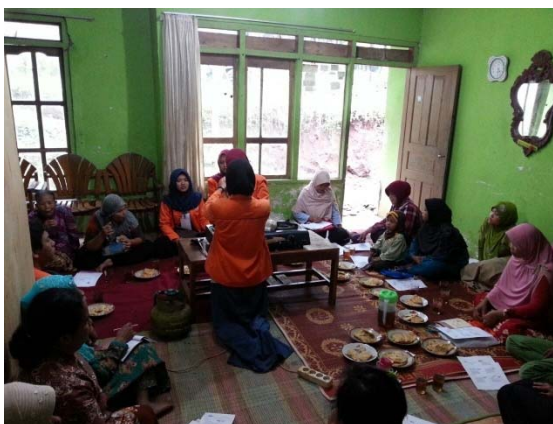
Gambar 2. Pelatihan membuat serbuk jahe instan

Berdasarkan data jenis pekerjaan serta potensi yang ada di desa Karanggondang, aktivitas mahasiswa KKN sangat tepat memberikan pelatihan guna menumbuhkan jiwa kewirausahaan untuk meningkatkan perekonomian masyarakat. Pemberdayaan yang diberikan kepada kaum wanita dalam bentuk pelatihan pengolahan jahe menjadi serbuk instan dan pembuatan nugget berbahan dasar tempe. Aktivitas kedua pelatihan tersebut dapat dilihat pada gambar 2 dan 3.