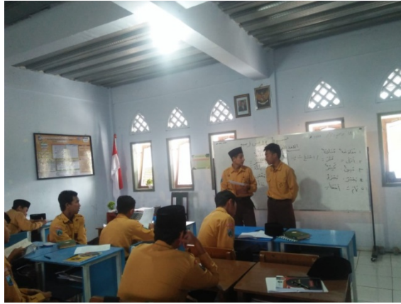
الصورة ٣: عملية عرض نتائج المناقشة

بناءً على هذا الوصف، يُظهر أن نموذج التعلم "تبادل المجموعات" بمساعدة أوراق عمل الطلاب تترقى دوافع الطلاب في التعلم في مادة المطالعة بمدرسة الأم الثانوية. في هذا البحث، وجد الباحث العيوب في نموذج التعلم "تبادل المجموعات" بمساعدة أوراق عمل الطلاب في تقديم البحث بين المجموعة أن بعض الطلاب أقل اهتمام، عند رأي الباحث أن هؤلاء الطلاب صُنفوا على أنهم ضعيف في فهم المادة. مما أدى إلى ناقص الانتباه. كان بعض الطلاب مشغول بأوراق العمل لأنهم أرادوا إتقان المادة كما شعر أحد الطلاب في المجموعة ليس صحيحًا تمامًا في الترجمة، بسبب ذلك كان هناك ناقص في الاهتمام بالمقدم.