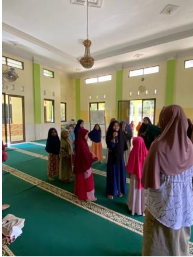
الصورة 3: الشجاعة