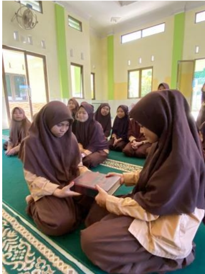
الصورة 5: التعاون

”تظهر القيمة الاجتماعية لتعاون التلاميذ خلال أنشطة خدمة المجتمع، حيث يهتم التلاميذ بالبيئة ويساعدون بعضهم البعض ويعملون معاً في تنفيذ الخدمة المجتمعية. بالإضافة إلى ذلك، في سياق تعلم اللغة العربية، غالباً ما يتم وضع التلاميذ في مجموعات صغيرة حيث يمكنهم مساعدة بعضهم البعض في فهم المفاهيم الصعبة، وممارسة التحدث باللغة العربية، وتحفيز بعضهم البعض“ (إمام معسوم، الأستد معهد الأيتام و الضعفاء).