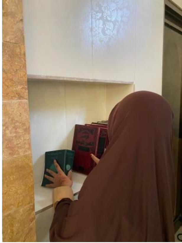
الصورة 2: الأمانة

الصورة 2 تدل على القيم الاجتماعية لأمانة في تعلم اللغة العربية لدى تلاميذ المعهد الأيتام والضعفاء في قيامهم بواجبات الاعتصام، كل حسب وظيفته وجدوله، مثل تنظيف السكن، وتنظيف الفصول، وتنظيف المسجد، وترتيب الرفوف، وغير ذلك. وعلمهم أن ينجزوا واجباتهم بمسؤولية كاملة، ودون ارتكاب غش آخر. وهذا يخلق بيئة تعليمية تتسم بالنزاهة والإنصاف. كما تلعب القيم الاجتماعية للأمانة دورًا مهمًا في تعلم اللغة العربية في المعهد. تشير الأمانة إلى الثقة والمسؤولية والنزاهة في كل شيء، سواء كان ذلك في المهام الأكاديمية أو التفاعلات الاجتماعية. من المتوقع أن يكون التلاميذ في المعهد مسؤولين عن مهامهم الأكاديمية. من خلال تعزيز القيمة الاجتماعية للأمانة في تعلم اللغة العربية في المعهد، لا يطور التلاميذ مهارات أكاديمية قوية فحسب، بل يكون أيضًا شخصيات مسؤولة ونزيهة تساعد على أن يصبحوا أفرادًا نافعين للمجتمع.