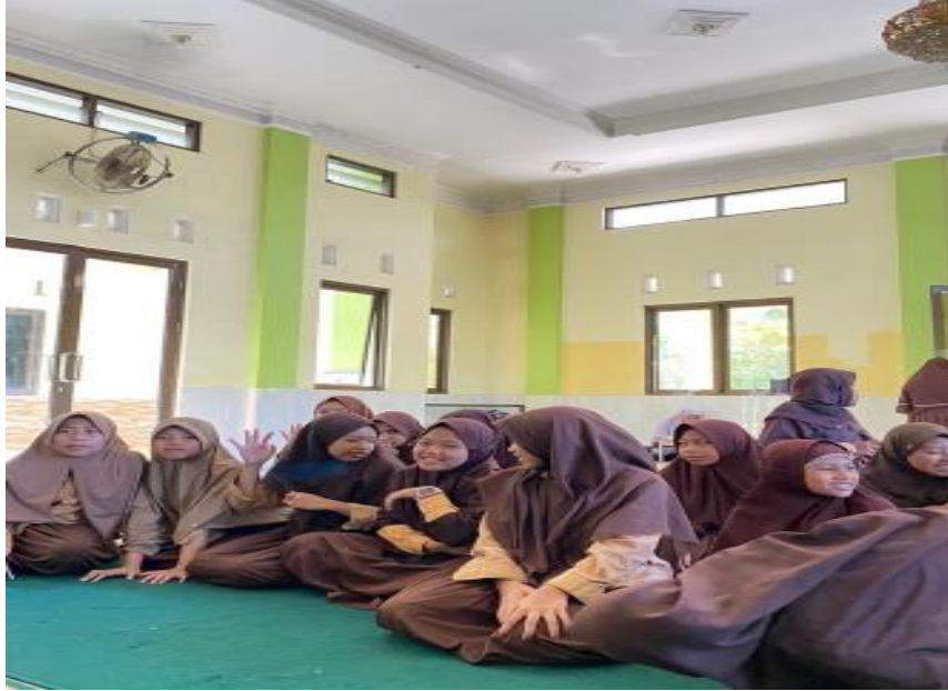
الصورة 1: الصدق