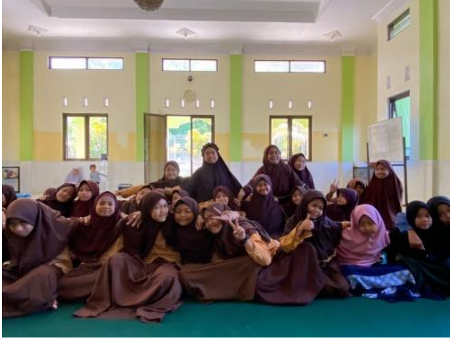
الصورة 4: الود/ التراحم

الصورة 4 تدل على أن قيمة الود/التراحم في تعلم اللغة العربية لدي تلاميذ المعهد الأيتام والضعفاء تشجع على التعاون في التعلم. غالبًا ما يدرس الطلاب في المدارس الداخلية الإسلامية في مجموعات صغيرة، حيث يساعدون ويدعمون بعضهم البعض في فهم مواد اللغة العربية المعقدة. يتعلم التلاميذ في المعهد من خلال التفاعلات القائمة على قيمة الود/التراحم التواصل بشكل جيد، والإصغاء بانتباه، وحل النزاعات بسلام. هذه المهارات الاجتماعية ليست مفيدة في سياق تعلم اللغة العربية فحسب، بل في الحياة اليومية أيضًا.