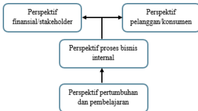
Gambar 2 , Model penerapan BSC pada RS Pemerintah

Pemerintah yang berorientasi pada kategori pure nonprofit dilihat dari masing-masing perspektif BSC memiliki relasi. Hal ini juga berlaku pada RSUD Mokoyurli sebagai satu-satunya RS milik daerah kabupaten Buol. Dimulai dari pertumbuhan dan pembelajaran apabila pegawai/SDM tercukupi dan setiap SDM meningkatkan kompetensi/ skill mereka melalui berbagai pelatihan yang diselenggarakan maka akan mempengaruhi.